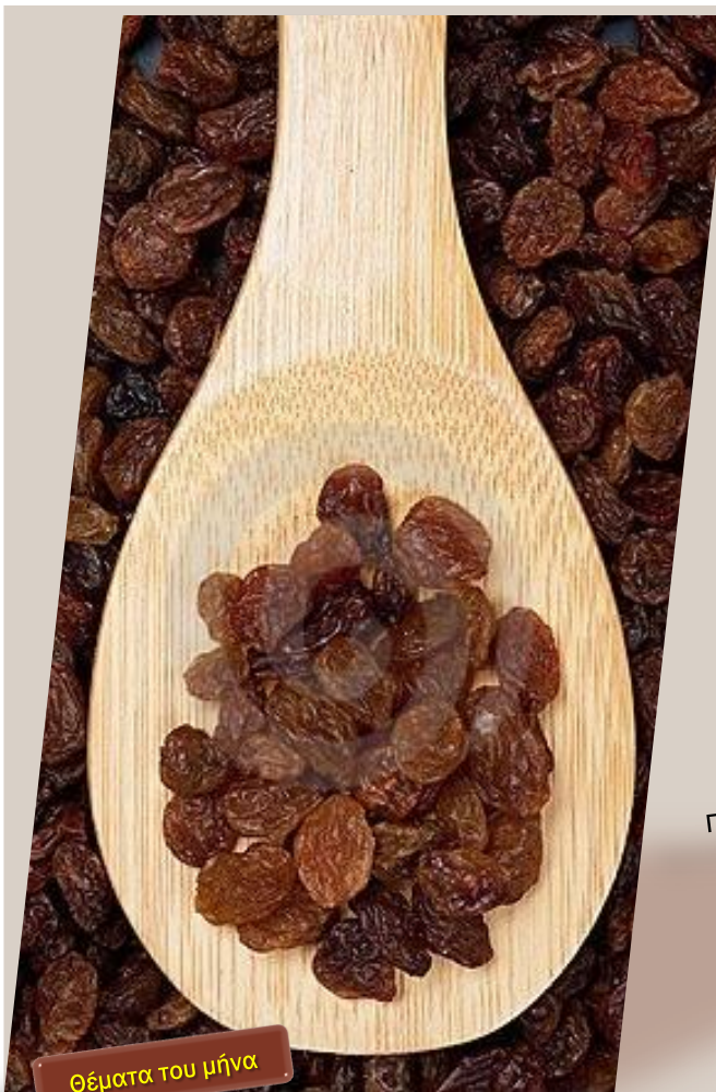
Θέματα του μήνα

Το Ευρωπαϊκό Δίκτυο Αγροτικής Ανάπτυξης είναι το κομβικό σημείο που συνδέει τους συμμετέχοντες φορείς αγροτικής ανάπτυξης σε ολόκληρη την Ευρωπαϊκή Ένωση. Ανακαλύψτε τι σημαίνει το Ευρωπαϊκό Δίκτυο Αγροτικής Ανάπτυξης http://enrd.ec.europa.eu/gr/home-page_gr.cfm για εσάς και πώς συμβάλλει στην αποτελεσματική εφαρμογή των στρατηγικών αγροτικής ανάπτυξης μέσω της ανάπτυξης και του διαμοιρασμού της γνώσης, καθώς και της ανταλλαγής και συνεργασίας σε ολόκληρη την Ευρώπη.